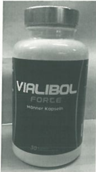
Fig.1: Imagen del producto VIALIBOL FORTE CÁPSULAS.