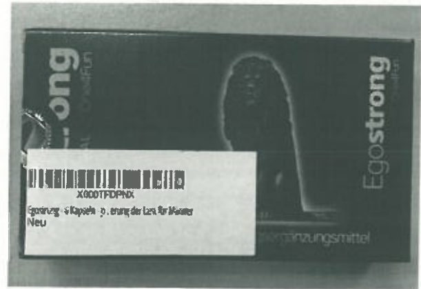
Fig.2: Imagen del producto EGOSTRONG CÁPSULAS.