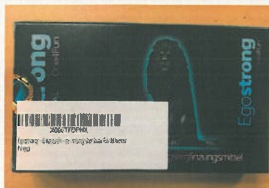
Fig.2: Imagen del producto EGOSTRONG CÁPSULAS.

Para cualquier duda pueden ponerse en contacto con este Servicio de Ordenación Farmacéutica y Medicamentos en: